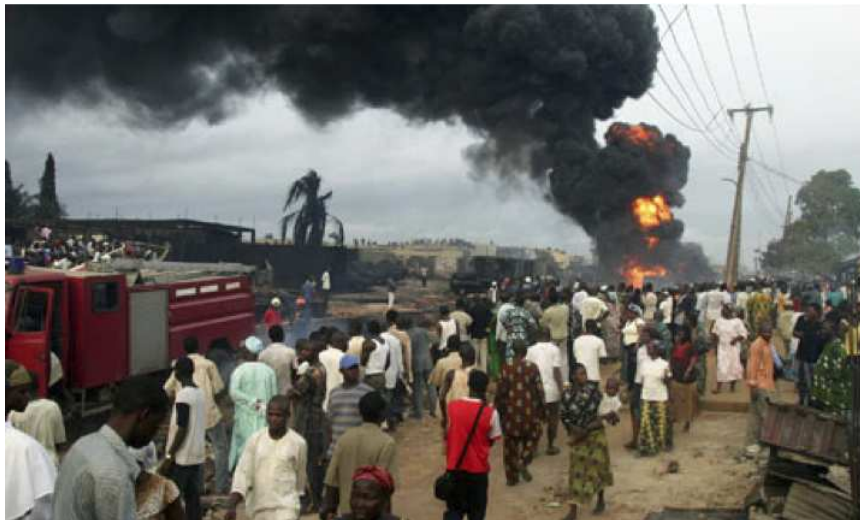
2. ábra Nigéria agóniája az olajszennyezés miatt

Tehát a katasztrófa sorozatnak, a régi Rendszer ellehetetlenülésének folytatódnia kell, és folytatódik is. Soha többé nem fogunk tudni a régi módon élni, az életfeltételek visszavonhatatlanul, egyszer és mindenkorra megváltoznak. Hogy hogyan és miképp? Nem tudom, mert a múltból kiinduló emberi elmével fel nem fogható. Csupán várni és szemlélni tudjuk, hogyan illenek ebbe a Mexikói Öböl eseményei. De biztos vagyok abban, hogy valami olyasmi bontakozik ki figyelő szemeink előtt, aminek hatalmas jelentősége van megannyi szinten az egész Életre.