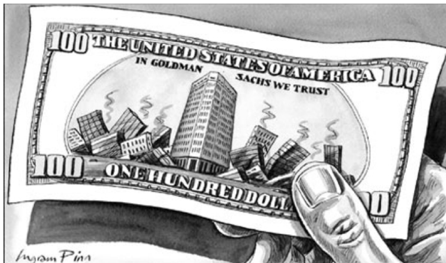
I. ábra Mi a Goldman Sachs-ben bízunk

A Goldman Sachs eladta BP részvényei 44%-át, összesen 4,680,822 részvényt, ami bő 300 milliónyi dollárt ért. Ez néhány héttel a Gulf szerencsétlenség előtt történt. A csapás után a BP részvényárai lezuhantak. Tony Hayward, a BP botrányos vezérigazgatója eladta az ő 1.4 millió fontnyi BP részvény csomagját egy hónappal a robbanás előtt. A nyereség lehetővé tette, hogy kifizesse a jelzálogot a kastélyán. Milyen ügyes! Hát hiába, élni tudni kell!