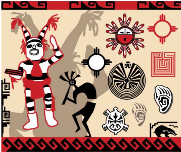
3. ábra Hopi jövendőlés